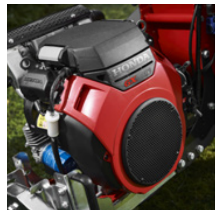
Tosylindret, luftavkjølt HONDA bensinmotor med elstart