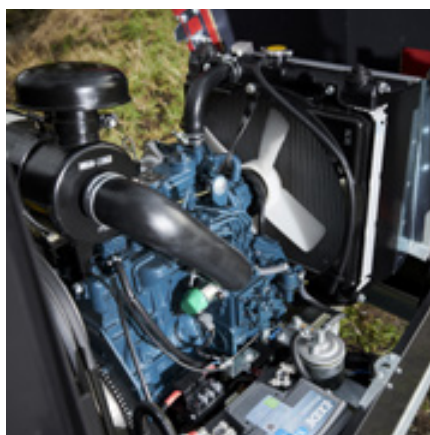
High torque 3 eller 4 cyl. Kubota