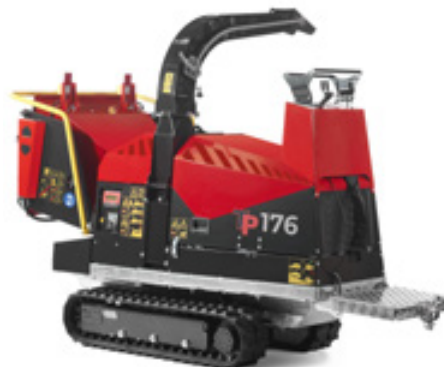
Manuel betjening og plattform med sikkerhetsafbryder