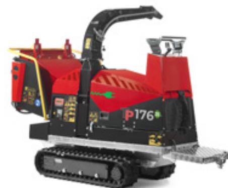
Manuell betjening og plattform med 20 kg sikkerhetsbryter

TP 176 TRACK ZE er den eneste 100 % null utslipp skivehakkeren i sin klasse. Miljøpåvirkningen til TP 176 TRACK ZE er minimal. Den 65 Volt store elektriske PMAC-motoren har et dreiemoment på opptil 100 Nm. Litiumbatteriets 325 ampere sikrer opptil fem timers drift med blandet materiale. Strømforsyning: 230 Volt.