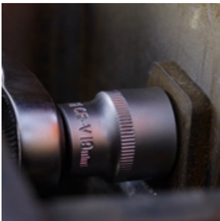
Enkel og enkel service