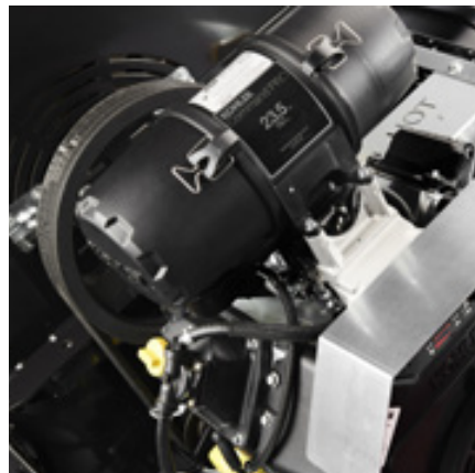
Kohler Pro bensinmotor