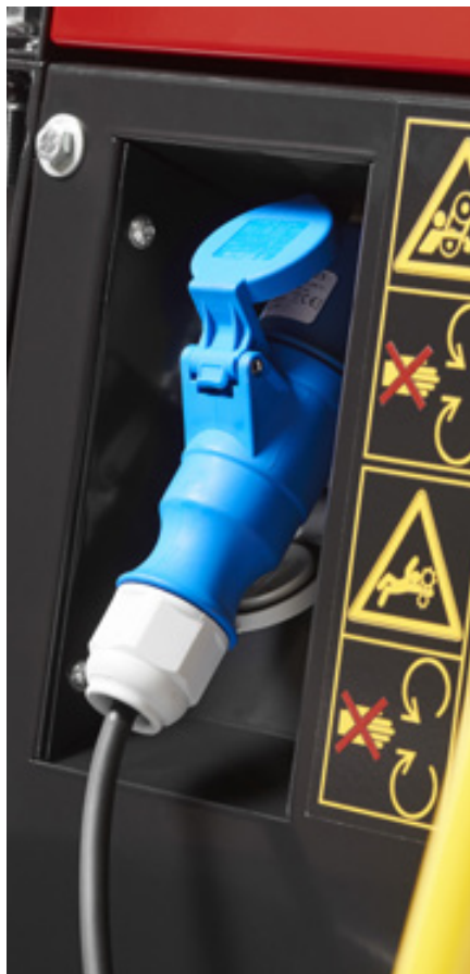
Integrert lader: 230V 16A 65V og kabel