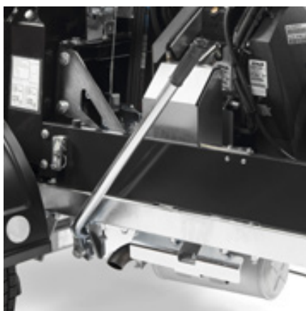
Mekanisk clutch og gass.