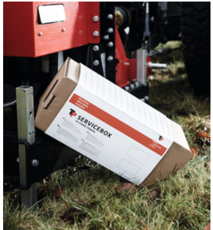
TP SERVICE BOX

TP Flishuggere er bygget for å tåle en støyt, men slitedelene varer selvfølgelig ikke evig. Vi anbefaler at du alltid bruker originale slite- og reservedeler, og at du skifter ut slidedelene til rett tid. På denne måten oppnår du både bedre fliskvalitet og bedre drivstofføkonomi. Samtidig optimerer du driftssikkerheten og forlenger flishuggerens levetid. Vi leverer fremdeles deler til TP Flishuggere som har mer enn 20 år på baken!