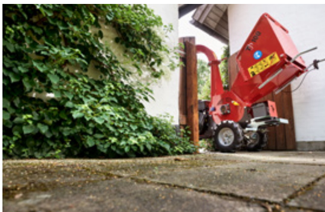
Bredde: 74 cm Vekt: 314 kg