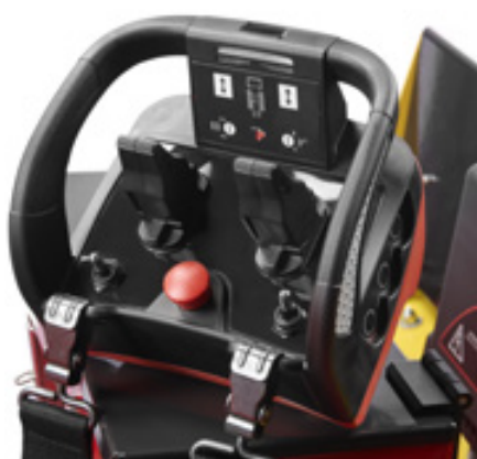
Sikkerhet og komfort med fjernstyring