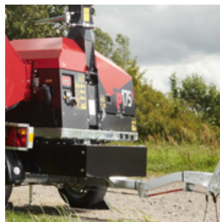
220° sving er ekstrastyr (øker vekten med 80 kg)