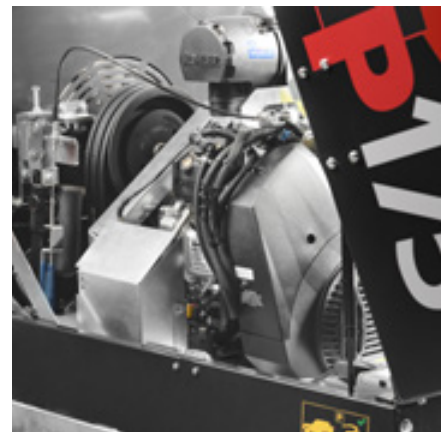
Sterk Kohler EFI-motor med 38 hk