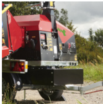
Dreieskive er mulig som ekstrautstyr.