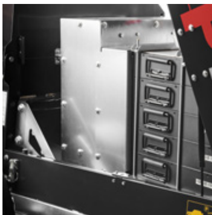
325 ampere (5 timer). Litiumbatterier (LiNiMnCoO 2 65V) gir opptil 5 timers drift.