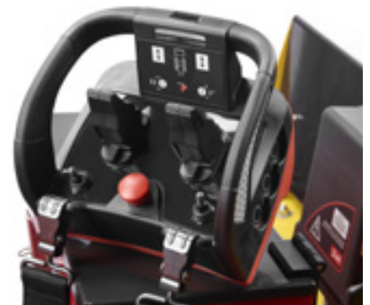
Komfort med Remote Control