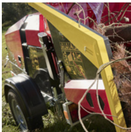
TP Easy Control. Reset – Reverse – Go