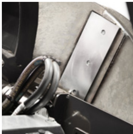
To kniver er konstant i kontakt med materialet