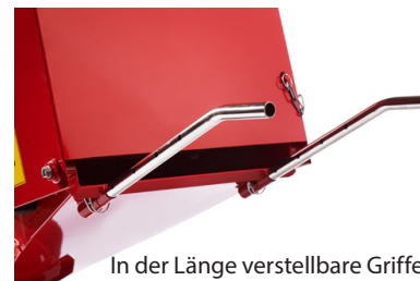
In der Länge verstellbare Griffe