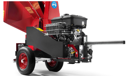
In der Höhe verstellbarer Stützfuß